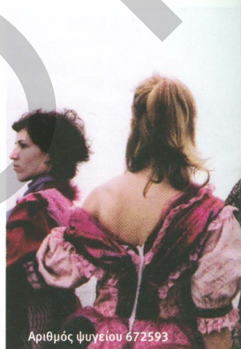
Αριθμός ψυγείου 672593

Το British Council, στο πλαίσιο της επιτυχημένης τριετούς συνεργασίας του με την Κρατική Σχολή Ορχηστρικής Τέχνης, παρουσιάζει το πρόγραμμα ταινιών Video Dance 5 PATHS και τη φωτογραφική έκθεση Εν Κινήσει της Μαργαρίτας Λυγίζου.